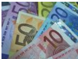
Cash Back Bonus

Bei der Anschaffung einer HiPath 33x0 oder HiPath 35x0 erhalten Sie direkt von uns einen Cash Back Bonus. Bei der HiPath 33x0 beträgt dieser 100€ und zusätzlich 20€ für jedes OpenStage 15 und größer.